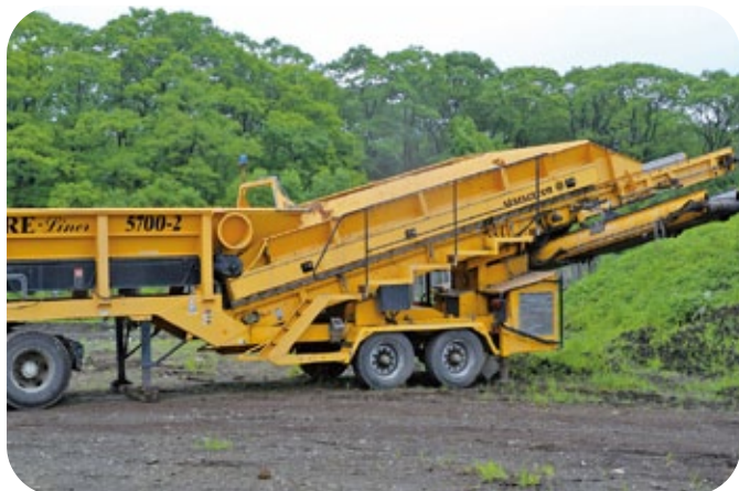
スタースクリーン